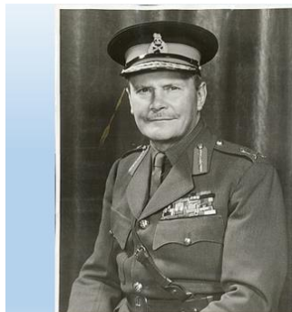
Ο Υποστράτηγος Μπέρναρντ Φρέϋμπεργκ(1889-1963) . Επικεφαλής των Συμμαχικών και Ελληνικών δυνάμεων (GREFORCE).

Επικεφαλής των Συμμαχικών και Ελληνικών δυνάμεων (GREFORCE) για την ά-