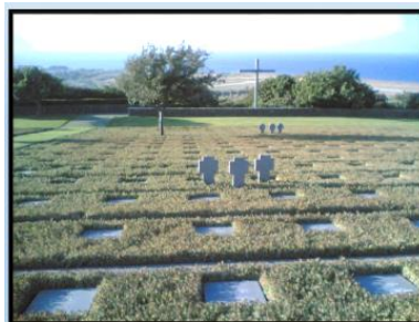
Το γερμανικό νεκροταφείο στο Μάλεμε.

Η ελληνική ανδρεία έχει ηθικό περιεχόμενο. Γι' αυτό υπό την κλασσική έννοια η λέξη «αρετή» σημαίνει «ανδρεία» και η λέξη «αγαθός» σημαίνει «ανδρείος». Ο πολεμιστής δοξάζεται περισσότερο από την ηρωική προσπάθεια παρά από την νίκη. Σε μια χρονική στιγμή που ο Χίτλερ βρισκόταν στο απόγειο της δυνάμεώς του και είχε υποτάξει σχεδόν ολόκληρη την Ευρώπη. Όσοι και όσες πολέμησαν στην μάχη της Κρήτης προσέφεραν στον υπόλοιπο κόσμο ένα φωτεινό παράδειγμα, πως ένα μικρό έθνος μπορεί να ορθώσει το ανάστημά του και να υπερασπισθεί την ελευθερία του. Ήταν μια πράξη με εσωτερικό μεγαλείο, η οποία προκάλεσε το θαυμασμό του ελεύθερου κόσμου και εξακολουθεί ακόμα να κερδίζει την εκτίμηση του.