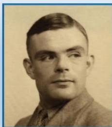
Ο Μαθηματικός Άλαν Τούρινγκ.

Την παραμονή της Γερμανικής επιθέσεως η γερμανική πλευρά είχε απόλυτη αεροπορική υπεροχή, ενώ οι Βρεττανοί κυριαρχούσαν στην θάλασσα. Η έκβαση της μάχης θα κρίνονταν από το αν οι Γερμανοί θα κατόρθωναν να καταλάβουν ένα από τα τρία αεροδρόμια του νησιού, Μάλεμε, Ηρακλείου, ή Ρεθύμνου (Πη-