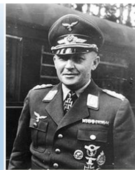
Ο Αντιπύραρχος Κούρτ Στούντεντ. (1890-1978). Διοικητής του 11 ου Αεροπορικού Σώματος της Λουφτβάφε.

Ο διοικητής των δυνάμεων για την κατάληψη της Κρήτης ήταν ο 51ος χρόνων Γερμανός Αντιπύραρχος Κούρτ Στούντεντ (Kurt Student), διοικητής του 11 ου Αεροπορικού Σώματος της Λουφτβάφε. Κατά τον Α΄ ΠΠ πολέμησε ως πιλότος, έχοντας καταγράψει 6 καταρρίψεις. Τον Β΄ ΠΠ τοποθετήθηκε επικεφαλής των δυνάμεων Αλεξίπτωτιστών. Ήταν ο τυπικός Πρώσος Αξιωματικός, αυστηρός, σχολαστικός, εργασιομανής και εμμονικός κατά την εκτέλεση των καθηκόντων του. Κατά την εισβολή στην Ολλανδία ένα χρόνο πριν, τραυματίστηκε σοβαρά, όταν μία σφαίρα διαπέρασε την μία πλευρά του εγκεφάλου του. Μετά τον πόλεμο καταδικάσθηκε σε 5ετή φυλάκιση για εγκλήματα πολέμου, που διαπράχθηκαν στην μάχη της Κρήτης, κατά αιχμαλώτων στρατιωτικών, αλλά όχι κατά αμάχων. Απεβίωσε το 1978.