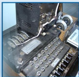
Κρυπτογραφική Συσκευή «Αίνιγμα» με εκτυπωτή.