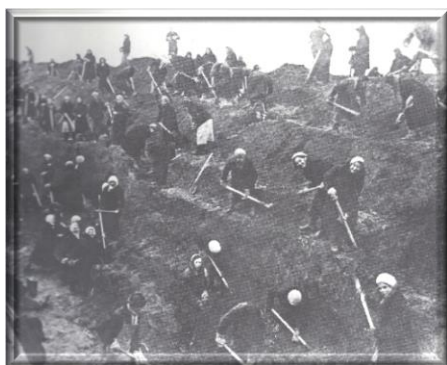
Μοσχοβίτισες σκάβουν αντιαρματική τάφρο.

Έως το τέλος του 1941, οι απώλειες των Γερμανών στο ανατολικό μέτωπο ανήλθαν σε 750.000 άνδρες επί συνόλου 3,5 εκατ. Οι ρωσικές απώλειες ήταν τριπλάσιες, ενώ οι Ρώσοι είχαν καλέσει υπό τα όπλα περισσότερους από 5 εκατ. άνδρες. Από την 13 η Απρ. 1941 η ΕΣΣΔ και η Ιαπωνία είχαν υπογράψει 5ετές σύμφωνο μη