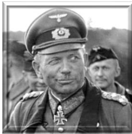
Ο Στρατηγός Χάιντς Γκουντέριαν

στρατιωτικών, σχετικά με το ποιος επωμίζεται την ευθύνη διεξαγωγής του πολέμου. Ο Χίτλερ επικαλούμενος τον Μέγα Φρειδερίκο, αισθάνονταν ότι οι Γερμανοί στρατιώ-