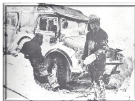
Ακίνητοποιημένο όχημα στο χιόνι.

Ο Γκουντέριαν έχοντας συνειδητοποιήσει το ανέφικτο συνεχίσεως της επιθέσεως, έπεισε την στρατιωτική ιεραρχία, όχι όμως και τον Χίτλερ ο οποίος επιθυμούσε διακαώς την κατάληψη της Μόσχας, να υποχωρήσει σε ασφαλέστερη αμυντική τοποθεσία. Την 20 η Δεκ. μετέβη στο αρχηγείο του Χίτλερ στην ανατολική Πρωσία, προκειμένου να του περιγράψει την επικρατούσα στο μέτωπο κατάσταση, η οποία μπορούσε να εξελιχθεί σε πανωλεθρία για τον γερμανικό στρατό. Ο Γκουντέριαν όταν χαιρέτησε τον Χίτλερ, αντελήφθη από το βλέμμα του, ότι τον είχαν προδιαθέσει εναντίον του. Είχαν ξανασυναντηθεί ξανά την 24 η Αυγ. 1941, όταν δεν κατόρθωσε να τον πείσει ότι έπρεπε πρώτα να καταλάβουν την Μόσχα και μετά την Ουκρανία. Αυτό που φάνταζε στρατιωτικός περίπατος τότε, είχε εξελιχθεί πλέον σε Γολγοθά. Η αντιμετώπιση των στρατιωτικών επιχειρημάτων του Γκουντέριαν μεταφέρθηκε στο πεδίο της διαχρονικής αντιπαράθεσης μεταξύ των πολιτικών και των