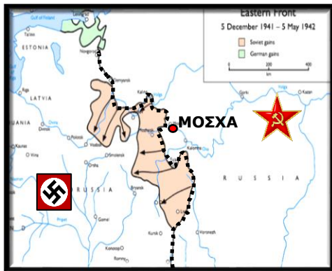
Χάρτης τῆς μάχης τῆς Μόσχας.

Τὴν 19 η Δεκεμβρίου 1941, ὁ Χίτλερ ἐπαυσε τὸν ἀρχηγὸ τοῦ Γερμανικοῦ Στρατοῦ, Στρατάρχη Βάλτερ Μπράουχιτς, ἀναλαμβάνοντας ὁ ἴδιος τὴν θέση του. Τὴν