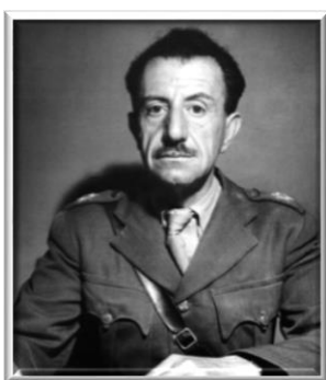
Ο συνταγματάρχης Στέφανος Σαράφης.

Το χρονικό διάστημα από 10 Οκτ. 1943 έως 29 Φεβ. 1944, δυνάμεις του ΕΛΑΣ (Ελληνικός Λαϊκός Απελευθερωτικός Στρατός) που συγκροτούσαν το στρατιωτικό σκέλος του ΕΑΜ (Εθνικό Απελευθερωτικό Μέτωπο), προσπάθησαν να διαλύσουν τις ΕΟΕΑ (Εθνικές Ομάδες Ελλήνων Ανταρτών), που αποτελούσαν τα ένοπλα τμήματα του ΕΔΕΣ (Εθνικός Δημοκρατικός Ελληνικός Σύνδεσμος). Ο ΕΛΑΣ κυριαρχούσε σε ολόκληρη την ηπειρωτική Ελλάδα, ενώ ο ΕΔΕΣ επικρατούσε στην ευρύτερη περιοχή της Ηπείρου. Ο ΕΛΑΣ διέθετε 35.000 άνδρες και 20.000 σε εφεδρεία, ενώ ο ΕΔΕΣ 8.000 άνδρες και ελάχιστες εφεδρείες. Ο συνταγματάρχης Στέφανος Σαράφης ήταν ο στρατιωτικός διοικητής του ΕΛΑΣ και είχε την έδρα του στο Περτούλι Τρικάλων. Ο γενικός γραμματέας του ΚΚΕ Γιώργος Σιάντος ήταν όμως ο ουσιαστικός αρχηγός. Ο αρχηγός του ΕΔΕΣ συνταγματάρχης Ναπολέον Ζέρβας είχε το αρχηγείο του στο χωριό Βουλγαρέλι στο όρος Τζουμέρκα του νομού Άρτης. Την 5 η Ιουλ. 1943, μετά από πιέσεις του Συμμαχικού Στρατηγείου Μέσης Ανατολής (ΣΣΜΑ), δημιουργήθηκε Κοινό Γενικό Στρατηγείο Ανταρτών στο Περτούλι, στο οποίο εγκαταστάθηκαν αντιπροσωπίες από τον ΕΔΕΣ και την ΕΚΚΑ (Εθνική και Κοινωνική Αναγέννηση), του Συνταγματάρχου Δημητρίου Ψαρρού.