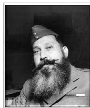
Ο Συνταγματάρχης Ναπολέον Ζέρβας.

Ο Σιάντος έχοντας εξασφαλίσει την στρατιωτική υπεροπλία, ήθελε να παρουσιάσει