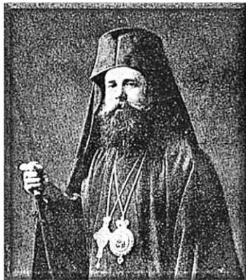
Ο Αρχιεπίσκοπος Χρυσάνθος.

Το αποτέλεσμα της δυσμενούς τροπής της καταστάσεως υπήρξε η συνέχιση των απηνών διωγμών του ελληνικού πληθυσμού του Πόντου. Στις 16 Μαρτίου 1921 ο Κεμάλ υπέγραψε «Συνθήκη Φιλίας και Αδελφότητας» με την Σοβιετική Ένωση, η