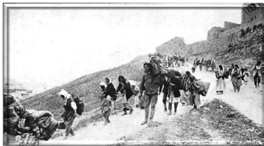
Οι Πορείες θανάτου.

Την 21 η Ιουλίου 1914, οι Έλληνες του Πόντου ηλικίας από 18 έως 50 χρονών κλήθηκαν για κατάταξη στα τάγματα εργασίας (αμπελέ ταμπουρού), τα οποία συγκροτήθηκαν με διττό σκοπό: Την αποψίλωση των ελληνικών πληθυσμών από τους άνδρες και την φυσική εξόντωση των υπηρετούντων σ' αυτά, υπό τις πλέον απάνθρωπες συνθήκες εργασίας. Μετά την απομάκρυνση των ανδρών, με πρόσχημα την απομάκρυνση των Ελλήνων από την ζώνη του μετώπου, υποχρέ-