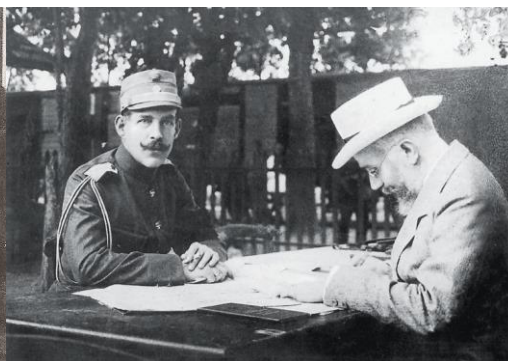
Ο Κωνσταντίνος και ο Βενιζέλος στο ελληνικό στρατηγείο στον σιδηροδρομικό σταθμό της Βυρώνειας.