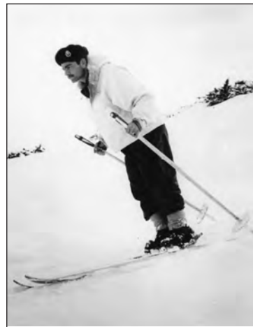
Έφεδρος Ανθυπολοχαγός στο Σέλι το 1957.

Ο Θεός να σε αναπαύσει και να παρηγορήσει τους οικείους σου.