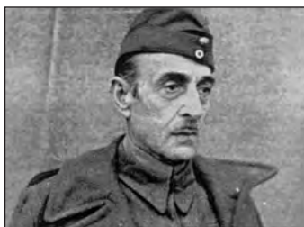
Μάρτιος 1944. Ο Αντιστράτηγος Αλ. Παπάγος κρατούμενος στο στρατόπεδο συγκεντρώσεως Ορανιέμπουργκ.

»Το όραμα της κοινωνικής δικαιοσύνης συναρπάζει την θερμόαιμον νεότητά. Ο σοσιαλισμός κυριεύει τας σκέψεις της. Τον θεωρεί ως το αποκορύφωμα της ελευθερίας, της ηθικής και της επιγείου δικαιοσύνης. Οιοσδήποτε ανεμίχθη εις τα κοινά - και μάλιστα εις μίαν χώραν θερμόαιμον - θα εφεύδeto εάν δεν ωμολόγη ότι δήληθεν κατά την πρώτην του νεότητά εκ της σοσιαλι-