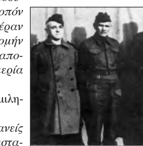
Οι αντιστράτηγοι Ι. Πισσίκας, Π. Δέδες, Αλέξανδρος Παπάγος, Κων. Μπακόπουλος και Γ. Κοσμάς, στο στρατόπεδο συγκεντρώσεως Νταχάου.

»Ατυχώς αι εργαζόμενοι μάζαι του λαού παρασύρονται από συνθήματα απατηλά και σχηματίζουν την εσφαλμένη αντίληψιν, ότι ο σοσιαλισμός κατοχυρώνει τα δίκαιά των με την κρα-