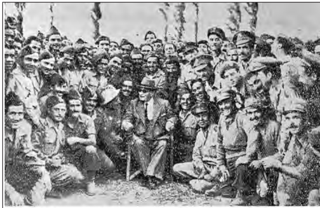
‘Ο γηραιός αγωνιστής Πρωθυπουργός Θ. Σοφούλης με τόν πολυήμερο επίτηλ’ της Ι Μεραρχίας ‘Αντισυνταγματάρχη Ι. Καρμή, έν μέση αξιωματικών και όπλατών στην Καστοριά, όπου τούς έθήριμαν την ψυχή.

Και στους δύο τόπους προσκυνήματος παρέστησαν επίσης: Εκπρόσωποι από τα πλησιέστερα παραρτήματα ΕΑΑΣ, τέως Βουλευτές Εκπρόσωποι Κομμάτων και ΟΤΑ, επαγγελματιών και Κοινωνικών Οργανώσεων, συγγενείς και φίλοι των πεσόντων και πολλοί άλλοι προσκυνητές.