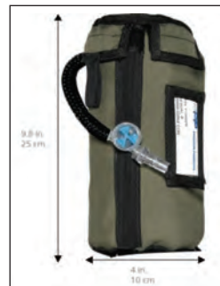
Συσκευή παραγωγής οξυγόνου O 2 PAK

Ο προβληματισμός στο χώρο των ειδικών δυνάμεων, οδήγησε στην κατασκευή μιας μικρής φορητής χημικής γεννήτριας οξυγόνου που κάλυπτε το κενό, με τον καλύτερο τρόπο! Η συσκευή O2PAK που φαίνεται στην παραπάνω εικόνα και κυκλοφόρησε στην αγορά το 2012, μπορεί να παράγει αρκετό οξυγόνο, ξεκινώντας τη λειτουργία της σε 4 δευτερόλεπτα, για να χορηγηθεί στον ασθενή ή τον τραυματία αμέσως στο σημείο όπου βρίσκεται, μέχρι να τον αναλάβουν τα χέρια πιο ειδικών!