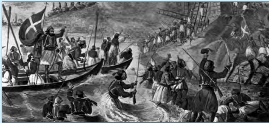
Η άλωση της Μονεμβασιάς. Ιούλιος του 1821. Μια αποβατική ενέργεια εκείνης της εποχής, όπως απεικονίζεται σε λιθογραφία του 1839.

Δεν θα κάνω εξιστόρηση εκείνης της περιόδου που έχει ήδη γίνει από πάρα πολλούς εκλεκτούς ιστορικούς. Μέσα από τ' απομνημονεύματα παλιών αγωνιστών όμως, μπορεί να διαβάσει κάποιος τακτικές και νυκτερινά καταδρομικά εγχειρήματα. Δεν εμβαθύνουν με λεπτομέρεια, γιατί είτε τα θεωρούν συνηθισμένα τεχνάσματα της στρατιωτικής τέχνης