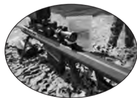
Τυφέκιο Ελευθέρου Σκοπευτού τύπου Barrett 0,50, για μεγάλες αποστάσεις και «σκληρούς» στόχους

με δυνατότητα άμεσης επέμβασης όποτε και όπου απαιτηθεί, ικανή να διεξάγει Ειδικές Επιχειρήσεις ανά πάσα στιγμή.