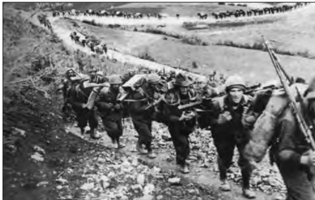
Ιταλοί αλπινιστές της μεραρχίας "Julia" σε πορεία προς τη γραμμή εξόρμησης

Αυτό βέβαια, σε συνδυασμό με τις ενέργειες των υπόλοιπων ιταλικών δυνάμεων, που κινούνταν κατά μήκος του παραθαλάσσιου άξονα (Μεραρχία Ιππικού και Μεραρχία Σιέννα (8) ), αλλά και της μεραρχίας Πιεμόντε (9) που ήταν στο αριστερό πλευρό των αλπινιστών.