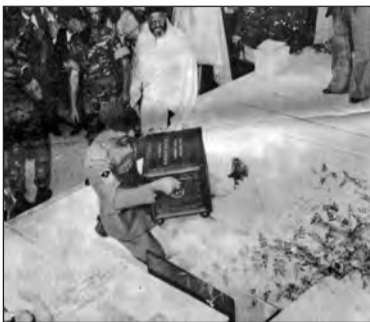
14 Σεπτεμβρίου 1977: Εναπόθεση της τέφρας του Στρατηγού Χριστόδουλου Τσιγάντε στο Α' Νεκροταφείο Αθηνών.

Όταν στις 14 Σεπτεμβρίου 1977 εκφώνησε το λόγο του ο Στρατηγός Κυριάκος Παπαγεωργόπουλος κατά την τελετή εναποθέσεως της τέφρας του Στρατηγού Τσιγάντε στο Α' Νεκροταφείο Αθηνών, έδωσε μια τελευταία υπόσχεση, ότι στη θέση εκείνη τοποθετείτο «προσωρινώς και μέχρις ότου αναπαυθεί οριστικά στο Μαυσωλείο του μέσα στο Μνημείο του Ιερού Λόχου που ανεγείρεται προσεχώς». Και η τελευταία εκείνη υπόσχεση προς το νεκρό Στρατηγό πραγματοποιήθηκε μετά από τέσσερα (4) ακριβώς χρόνια από μέρος όλων των