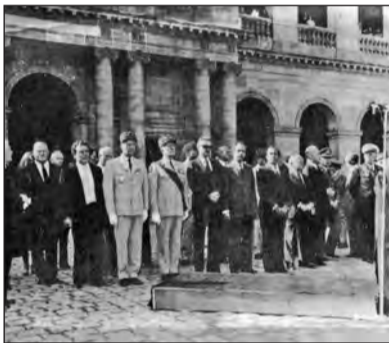
13 Σεπτεμβρίου 1977 Δέηση και απόδοση τιμών στο Παρίσι (Γαλλία)

Στο Παρίσι, η επιμνημόσυνη τελετή πραγματοποιήθηκε την επόμενη μέρα στον εσωτερικό υπαίθριο χώρο του ιστορικού και περίφημου κτιριακού συγκροτήματος ΙΜΥΑΚΙ ("Πάνθεον Απομάχων"), όπου στο κέντρο του είχε εναποτεθεί η τεφροδόχος με την τέφρα του Στρατηγού. Στο χώρο αυτόν -εξαιρετικά τιμητικό για Έλληνα νεκρό αξιωματικό- απονέμονταν οι τελευταίες τιμές, επί έναν και πλέον αιώνων, στους μεγάλους Γάλλους Αρχηγούς των διαφόρων πόλεμων.