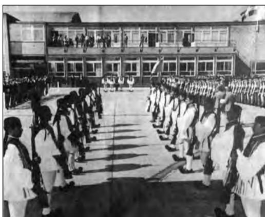
Απόδοση τιμών κατά την τελετή αναχωρήσεως από το αεροδρόμιο της RAF