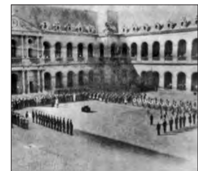
Επιμνημόσυνη δέηση στον ΙΜΥΑΚΙ ("Πάνθεον Απομάχων"). Απόδοση τιμών στην τέφραν του Στρατηγού Χριστόδουλου Τσιγάντε

Οι Γάλλοι θεωρούσαν δικό τους αξιωματικό τον Τσιγάντε, αφού είχε πολεμήσει μαζί τους στο Μακεδόνικο Μέτωπο (1916-1918), αλλιά κυρίως με τις δικές τους "Ελευθères Δυνάμεις" και στο πλευρό των Στρατηγών Καινίνγκ και Λεκλιέρκ "κατά τας πλείον σκοτεινάς ώρας του πολέμου" (1941-1943). Εκτός από τις επίσημες αντιπροσωπείες των δύο χωρών, τους φίλους απόστρατους και εν ενεργεία Γάλλους Αξιωματικούς και τα στρατιωτικά τμήματα, είχαν λάβει τιμητική θέση απέναντι από την τεφροδόχο του Στρατηγού και οι Γαλλικές Πολεμικές Σημαίες των "Ελευθέρων Γαλλικών Δυνάμεων" που πολέμησαν στην Αφρική, με σημαντικό ρόλο βετεράνους πολεμιστές. Είχαν συγκεντρωθεί όλοι εκεί «δία να τιμήσουν, δια μίαν τελευταίαν φοράν, την σορόν ενός Έλληνος ήρωος».