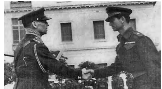
ΑΠΟΝΟΜΗ ΠΤΥΧΙΩΝ ΑΠΟ ΤΗΝ Α.Μ ΒΑΣΙΛΕΑ ΓΕΩΡΓΙΟ Β'

Προήχθη μέχρι τον βαθμό του Υποστράτηγου και υπηρετήσε επιπλέον ως Δκτῆς του 967 Λ/ΕΣΑ της Ιης Μεραρχίας, Δκτῆς 957 Λ/ΕΣΑ του Γ' Σ. Σ., Δκτῆς Λόχου 582 ΤΟ του 24 Σ. Π. της VIII Μεραρχίας, Δκτῆς Λόχου Μαθητών & Καθηγητής Σ. Ι. Σ., Δκτῆς Λόχου Δκσεως 19 Σ. Π. της VI Μεραρχίας, Δκτῆς Λόχου