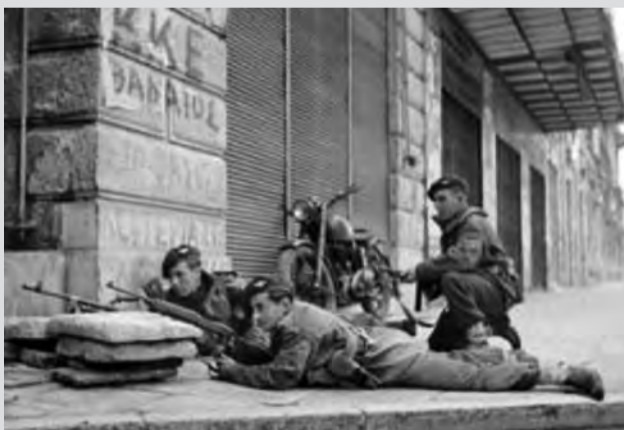
Βρετανοί αλεξιπρωτιστές στους δρόμους της Αθήνας, αντιμετωπίζουν αντάρτες του ΕΑΜ/ΕΛΑΣ

Στις 26 Σεπτεμβρίου, η δύναμη "Γ", αποβιβάστηκε