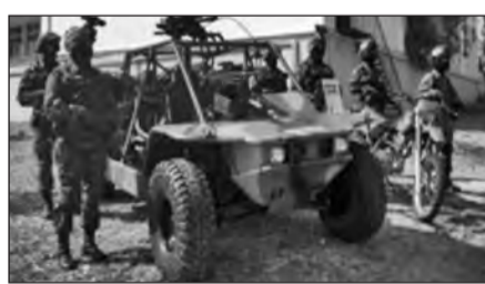
Τα οχήματα μάχης FLYER και οι μηχανές ανώμαλου δρόμου YAMAHA, αποτελούν τα καλύτερα μέσα στις αποστολές της μονάδας.

Η ελληνοτουρκική κρίση τον Ιανουάριο του 1996, επέβαλε την ανάγκη συγκροτήσεως μιας Μονάδας Αμέσου Αντιδράσεως, αποτελούμενης κατά βάση από μόνιμα στελέχη,