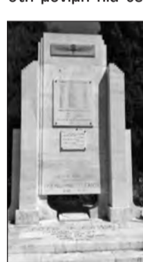
Το μνημείο όπως είναι σήμερα, μερικώς αποκατεστημένο. Ο βανδαλισμός του είναι προσβολή στη μνήμη του ήρωα Στρατηγού

Κατά τη διάρκεια της τελετής των αποκαλυπτηρίων του Μνημείου, παρουσία επισήμων, συγγενών, Ιερολοχιτών, Καταδρομέων και λοιπών προσκεκλημένων, έγινε η εναπόθεση του κιβωτίου με την τεφροδόχο του Στρατηγού στη μόνιμη πια θέση της που ήταν το μικρό Μαυσωλείο του Μνημείου του Ιερού Λόχου. Είχε μεταφερθεί εκεί από τον οικογενειακό τάφο του αδελφού του στο Α' Νεκροταφείο Αθηνών, στο οποίο είχε διαφυλαχτεί επί τέσσερα ακριβώς χρόνια.