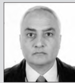
Υπό του Αντιστρατήγου ε.α. Ν. Λάζαρη Προέδρου της Λέσχης Καταδρομέων και Ιερολοχιτών

Δυστυχώς όμως, ο φανατισμός, το πάθος, το μίσος και ο τρόμος, είχαν προηγηθεί στην άφιξη. Ήδη το καζάνι του εμφύλιου σπαραγμού σιγόβραζε. Έτσι η απελευθέρωση δεν "εξαργυρώθηκε" με την αξία της θυσίας των Ελλήνων.