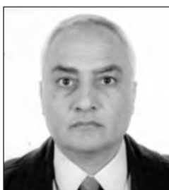
Υπό του Αντιστράτηγου ε.α. Ν. Λάζαρη Προέδρου της Λέσχης Καταδρομέων και Ιερολοχιτών

Η εκδήλωση αυτή ήταν έμπνευση και πρωτοβουλία του Δήμου Βέθου- Βόχας και είναι πρώτη φορά που τιμάται ο Στρατηγός στο χωριό του. Έτσι η απόδοση τιμής σε ένα αγωνιστή αποκτά ιδιαίτερη σημασία για όλους μας και αποτελεί ένα ελπιδοφόρο μήνυμα.