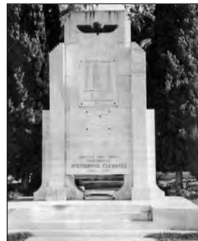
Το «Μνημείον του Ιερού Λόχου» στο Πεδίον του Άρεως (Αθήνα), με το Μαυσωλείο του Στρατηγού Χριστόδουλου Τσιγάντε, όπως ήταν τότε. (Φωτ. Αρχείο Λέσχης Καταδρομέων και Ιερολοχιτών).

Με την ορθή καθοδήγηση των Διοικήτων της και τον επαγγελματισμό του προσωπικού, η Ζ' Μοίρα Αμφίβιων Καταδρομών καταξιώθηκε στις Ειδικές Δυνάμεις ως Μονάδα πρότυπο, ισότιμη με τις υπόλοιπες μονάδες και αντάξια αντίστοιχων Μονάδων του εξωτερικού.