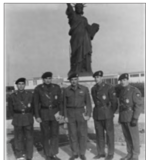
ΔΙΕΘΝΕΙΣ ΑΓΩΝΕΣ ΝΑΤΟ / ΙΤΑΛΙΑ 1955 ΟΜΑΔΑ ΚΑΤΑΔΡΟΜΩΝ

εκπρόσωπο των Ε.Δ, να με συνοδεύσει στη Διεύθυνση Καταδρομών, όπου είχα επιθυμία και νοσταλγία να επισκεφθώ χώρους όπου νεαρός είχα υπηρετήσει. Εκεί λοιπόν συνάντησα ένα Ταγματάρχη και τον ρώτησα αν ήξερε τι ήταν ένα αγαλματίδιο που ήταν μέσα στο δωμάτιο. Μου απήντησε επί λέξει «Δεν γνωρίζω λεπτομέρειες, έχω ακούσει ότι το λένε ΤΡΟΠΑΙΟ ΚΟΡΕΑΣ». Χαιρέτησα ακόμη μερικούς Αξιωματικούς και έφυγα όσο μπορούσα γρηγορότερα, ενθυμούμενος την αγωνία του Στρατηγού Ανδρέα Καλλίνσκη στην διάρκεια των αγώνων για την κατάκτηση του ΤΡΟΠΑΙΟΥ. Το έπαθλο λέγεται ΤΡΙΕΤΕ ΕΠΑΜΕΙΒΕΝΟ ΕΠΑΘΛΟ-