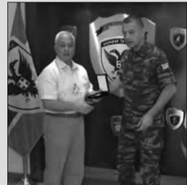
Ο Αντγος ε.α. κ. Νικόλαος Λάζαρης με τον Α/ΓΕΣ, Αντγο κ. Αθικιβιάδη Στεφανή

Κατά την διάρκεια της επίσκεψης, ο κ. Α/ΓΕΣ ενημερώθηκε για τις δραστηριότητες της Λέσχης και συζητήθηκαν θέματα που αφορούν στην συντήρηση του μνημείου του Ιερού Λόχου στο Πεδίο του Άρεως, και για την τελετή για την επέτειο των 75 χρόνων από ιδρύσεως του Ιερού Λόχου Μέσης Ανατολής.