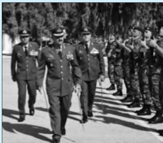
Επιθεώρηση τμημάτων από τον Ταξίαρχο κ. Παπαδημητρίου συνοδευόμενο από τον παραδίδοντα και τον παραλαμβάνοντα την μονάδα Διοικητή

Ο Αντιπρόεδρος της Λέσχης Ταξίαρχος ε.α. κ. Αθανάσιος Πουλάκης παρευρέθηκε προσκεκλημένος στη τελετή παράδοσης - παραλαβής της Διοικήσεως της 2ης ΜΑΛ, που έλαβε χώρα την Πέμπτη 10 Αυγούστου 2017, στην έδρα της μονάδας. Κατά την διάρκεια της τελετής, εκτός του Διοικητή της 1ης ΤΑΞ ΚΔ-ΑΛ, Ταξίαρχου κ. Κωνσταντίνου Παπαδημητρίου, ήταν παρόντες εκπρόσωποι του ΓΕΣ, αξιωματικοί ε.ε και ε.α των τριών κλάδων των Ενόπλων Δυνάμεων και των Σωμάτων Ασφαλείας, εκπρόσωποι της τοπικής Αυτοδιοίκησης, συγγενείς και φίλοι.