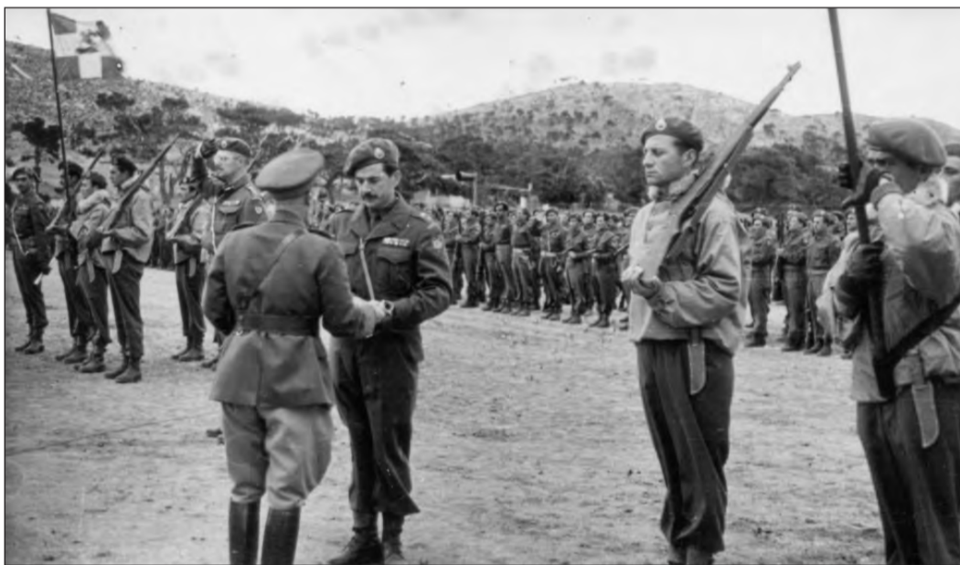
Απονομή Παρασήμου στις Σημαίες των Μοιρών Κ/Δ. Μάρτιος 1949.