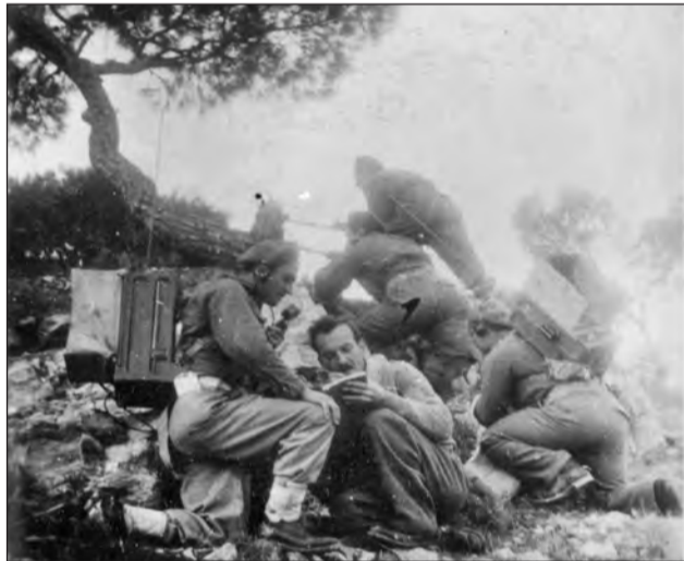
Επιχειρήσεις Ηπείρου (22-6-49 έως 7-7-49)

ανεφοδιασμού του και του στερούσε τα στρατόπεδα εκπαίδευσης που είχε ιδρύσει στο γιουγκοσλαβικό έδαφος. Επιπλέον εκατοντάδες αντάρτες λιποτακτούσαν ή παραδίδονταν αυτοβούλως σε μονάδες του ΕΣ απογοητευμένοι από την εξέλιξη του πολέμου και προδομένοι από τις μεγαλύτερες διακρύψεις της ηγεσίας τους περί «οριστικής συντριβής του μοναρχοφασισμού».