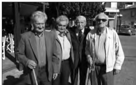
Ο Αντγος ε.α. κ. Κωνσταντίνος Κόρκας με συμπολεμιστές καταδρομείς

Το πρόγραμμα περιελάμβανε επίσκεψη στο Δίστομο και συνάντηση με τους ζώντες καταδρομείς του 14 ΛΟΚ, επίσκεψη στη μονή του Οσίου Λουκά, που βρίσκεται σε γραφική πηλιά του Εθίκωνα, και συνάντηση με συγγενείς των εκλιπόντων