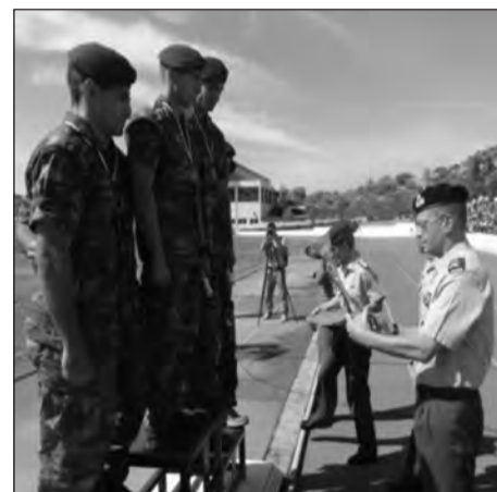
Ο Αρχηγός του ΓΕΣ, Αντγος κ. Αλκιβιάδης Στεφανής, απονέμει το κύπελλο στους νικητές

Μαραθώνας - Βάρη και βοή μάχης. Ο τερματισμός έγινε στο Διοικητήριο της ΣΣΕ, όπου παρουσιάστηκε η ιστορική δράση του Ιερού Λόχου στην αίθουσα του εντευκτηρίου, ενώ η απονομή των μεταλλίων έλαβε χώρα στο στάδιο της ΣΣΕ.