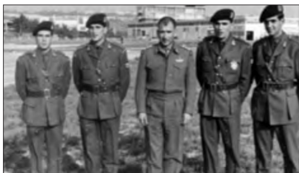
ΔΙΕΘΝΕΙΣ ΑΓΩΝΕΣ ΝΑΤΟ ΕΦΕΔΡΩΝ ΑΞΚΩΝ ΟΜΑΔΑ ΚΑΤΑΔΡΟΜΩΝ ΚΟΛΥΜΒΗΣΗΣ ΛΟΥΞΕΜΒΟΥΡΓΟ 1953

Πρωθυπουργό υπερήφανοι που φοράνε τον ΠΡΑΣΙΝΟ ΜΠΕΡΕ. Εδώ θα σταματήσω για να αποφύγω τα επιχειρησιακά ,τα οποία δεν είναι δυνατόν να περιγραφούν από εμένα, που δεν έχω το δικαίωμα. Θα επανέλθω στη περίοδο 1950-1956, όταν ο Στρατηγός Ανδρέας Καλλίνσκη έδινε τους πιο σκληρούς αγώνες εναντίον εκείνων που ζήλευαν ότι είχε σχέση με τις ΚΑΤΑΔΡΟΜΕΣ. Το 2003 ήμουν Διευθυντής της Διεύθυνσης αεΟΛΥΜΠΙΑΚΟΙ ΑΓΩΝΕΣ 2004-ΕΝΟΠΛΕΣ ΔΥΝΑΜΕΙΣ αε. Μετά από μία ΣΥΣΚΕΨΗ στο ΠΕΝΤΑΓΩΝΟ, ζήτησα από ένα Στρατηγό «Συνεργάτη»,