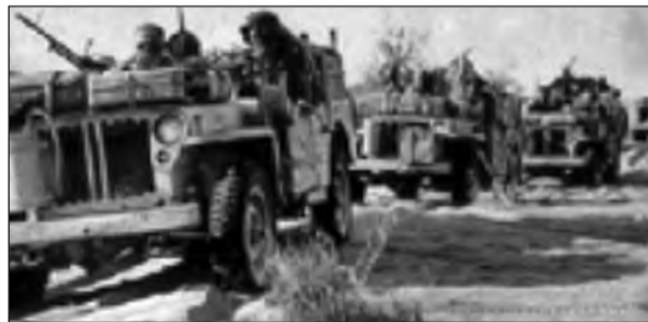
Τμήμα του ΙΛ σε αποστολή στην έρημο, με ειδικά εξοπλισμένα οχήματα ¼ τον.

Τοιγάντες, 1 απότακτος του βενιζελικού κινήματος της 1 ης Μαρτίου 1935, ανέλαβε την διοίκηση του. Τον μετονόμασε σε «Ιερό Λόχο (Ι.Λ.)», και καθιέρωσε ιδιαίτερο έμβλημα επί του οποίου αναγραφόταν η φράση «Η τάν ή επί τας». 2 Ο