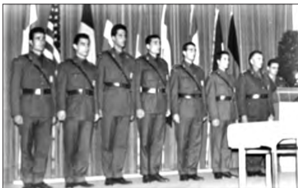
ΔΙΕΘΝΕΙΣ ΑΓΩΝΕΣ ΝΑΤΟ ΕΦΕΔΡΩΝ ΑΞΚΩΝ ΟΛΛΑΝΔΙΑ 1954

εκπρόσωπο των Ε.Δ, να με συνοδεύσει στη Διεύθυνση Καταδρομών, όπου είχα επιθυμία και νοσταλγία να επισκεφθώ χώρους όπου νεαρός είχα υπηρετήσει. Εκεί λοιπόν συνάντησα ένα Ταγματάρχη και τον ρώτησα αν ήξερε τι ήταν ένα αγαλματίδιο που ήταν μέσα στο δωμάτιο. Μου απήντησε επί λέξει «Δεν γνωρίζω λεπτομέρειες, έχω ακούσει ότι το λένε ΤΡΟΠΑΙΟ ΚΟΡΕΑΣ». Χαιρέτησα ακόμη μερικούς Αξιωματικούς και έφυγα όσο μπορούσα γρηγορότερα, ενθυμούμενος την αγωνία του Στρατηγού Ανδρέα Καλλίνσκη στην διάρκεια των αγώνων για την κατάκτηση του ΤΡΟΠΑΙΟΥ. Το έπαθλο λέγεται ΤΡΙΕΤΕ ΕΠΑΜΕΙΒΕΝΟ ΕΠΑΘΛΟ-