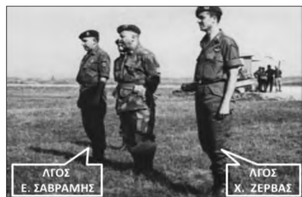
ΔΙΕΘΝΕΙΣ ΑΓΩΝΕΣ ΑΛΕΞΗΠΤΩΤΙΣΤΩΝ ΝΑΤΟ ΠΙΖΑ ΙΤΑΛΙΑΣ 1962

; Οι αντίπαλοι ήταν οι εννέα (9) ΜΕΡΑΡΧΙΕΣ του ΕΛΛΗΝΙΚΟΥ ΣΤΡΑΤΟΥ, η ΔΙΕΥΘΥΝΣΗ ΚΑΤΑΔΡΟΜΩΝ και η ΣΣΕ. Ο Αθλοθέτης ήταν ο Πρέσβης SIR EUGEN WIL-LICTON DRAKE. Ο αγώνας ήταν ΟΜΑΔΙΚΟΣ και ο καθένας από τους συμμετέχοντες εννέα (9) ΜΕΡΑΡΧΙΕΣ του ΕΛΛΗΝΙΚΟΥ ΣΤΡΑΤΟΥ, η ΔΙΕΥΘΥΝΣΗ ΚΑΤΑΔΡΟΜΩΝ και η ΣΣΕ συμμετείχε με μία πλήρη ΟΜΑΔΑ ΜΑΧΗΣ, η οποία αποτελείτο από ένα (1) Ομαδάρχη (Αξικός), ένα (1) Βοηθό (Υπεξικός), ένα (1) Οπλοπολυβολητή BAR και επτά