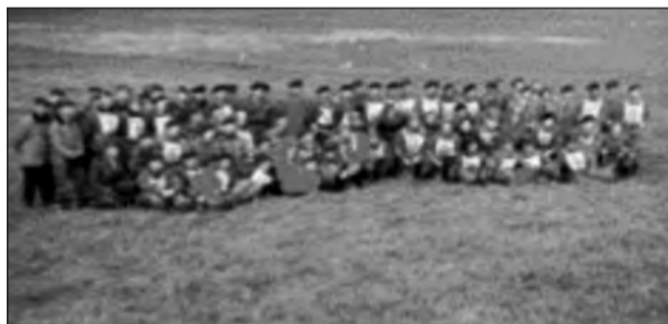
ΔΙΕΘΝΕΙΣ ΑΓΩΝΕΣ ΝΑΤΟ ΑΛΕΞΗΠΤΩΤΙΣΤΩΝ ΟΜΑΔΑ ΚΑΤΑΔΡΟΜΩΝ ΚΟΛΥΜΒΗΣΗΣ ΜΟΝΑΧΟ ΓΕΡΜΑΝΙΑΣ 1954

Σήμερα οι απανταχού Καταδρομείς νοιώθουν να διακατέχονται από κάτι που τους κάνει να ξεχωρίζουν από τους υπολοίπους. ΠΟΣΟΙ ΠΡΑΓΜΑΤΙΚΑ ΓΝΩΡΙΖΟΥΝ ΑΥΤΑ ΓΙΑ ΤΑ ΟΠΟΙΑ ΝΟΙΩΘΟΥΝ ΥΠΕΡΗΦΑΝΟΙ; Ακόμα και αυτοί οι ΑΞΙΩΜΑΤΙΚΟΙ που στέκονται καμαρωτοί πίσω από τους Προέδρους της Δημοκρατίας ή τον εκάστοτε