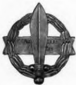
Το έμβλημα του Ιερού Λόχου.

«Παιδιά με άτσάλινα χέρια, με θάρρος γεμάτα ψυχή, στά χέρια μας είναι ή δόξα, τής πατρίδος μας και ή τιμή». Αντγος ε.α Ανδρέας Έρσελμαν, Η πρώτη στροφή του ύμνου του Ιερού Λόχου.