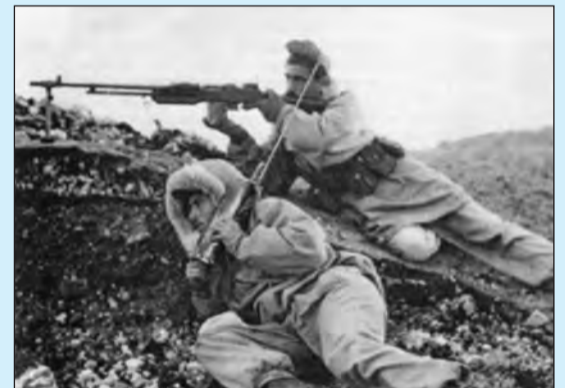
Καταδρομείς κατά την μάχη με αμερικανικό εξοπλισμό. Φορητός Ασύρματος SRC-536 και οπλοπολυβόλο BAR

Σε δύο ημέρες η ΔΚΒ υπέβαλε την έκθεση των επιχειρήσεων της στην τότε Διοίκηση Δυνάμεων