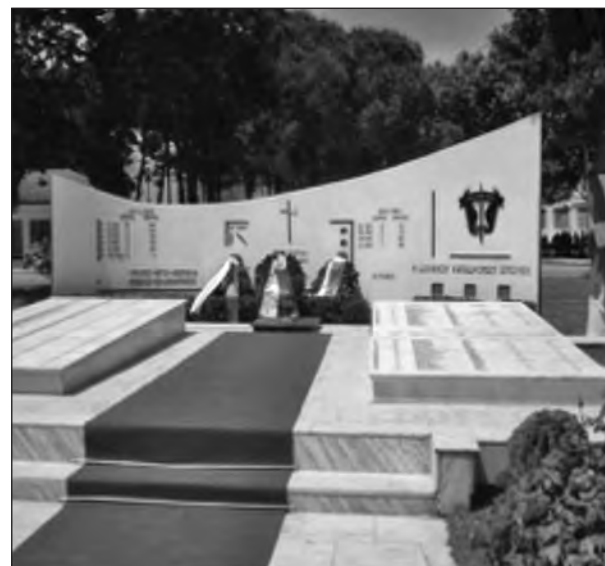
Μνημείο Καταδρομών στο στρατόπεδο "Κατσάνη" στη Ρεντίνα

Όλες οι απόψεις, που αποτελούσαν και συμπεράσματα από την επιχείρηση "Πύραυλος" έγιναν αποδεκτές από τον αρχιστράτηγο, όπως φάνηκε από τα μετέπειτα γεγονότα. Η παραπάνω επιχείρηση αφορούσε στην εκκαθάριση του κορμού της κεντρικής Ελλάδας από ανταρτικά τμήματα.