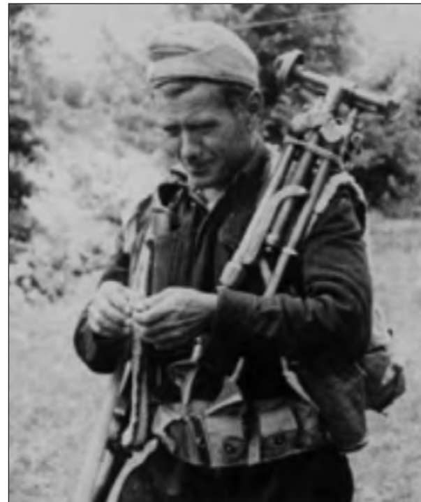
Μαχητής του ΔΣΕ με δίποδα όλμου

Έτσι το πρωί της 30ης Δεκεμβρίου, οι άνδρες του Παλαιολόγου καλούνται να αντιμετωπίσουν τις δυνάμεις των ΛΟΚ στα νώτα τους. Η 30η κυλά με μάχες ανάμεσα στους αντάρτες και τα ΛΟΚ και σφοδρές επιθέσεις των ανταρτών στον Προφήτη Ηλία. Η κατάσταση μένει στάσιμη και φαίνεται ότι ούτε τα ΛΟΚ από μόνα τους δεν δύνανται να ανατρέψουν την κατάσταση. Οι αντάρτες του ΔΣΕ αντιπάζουν στον υπέρτερο εξοπλισμό και οι δυνάμεις του ΕΣ αναγκάζονται να συμπτυχθούν στα εσωτερικά δρομάκια της πόλης. Πολλοί