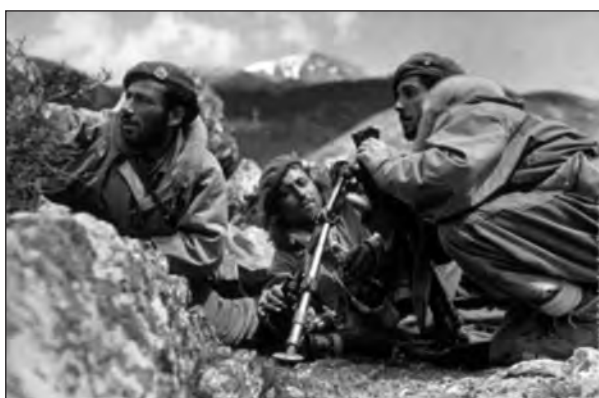
Στοιχείο όλμου 60 χιλ. μονάδων Καταδρομών κατά την διάρκεια του Συμμοριτοπολέμου

• Εξαναγκασμό του αντιπάλου σε ενίσχυση του μετώπου του με διάθεση ή κατάτμηση των εφεδρειών του