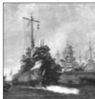
Η είσοδος του «χτυπημένου» Αντιτορπιλικού «Αδρίας» στην Αλεξάνδρεια, 6 Δεκ. 1943.