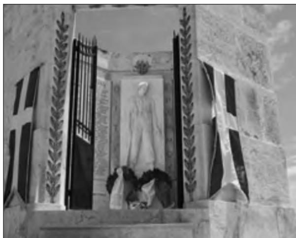
Μνημείο Καταδρομών στο Καβούρι

• Αναλάβουν μόνες τους οι μονάδες Καταδρομών