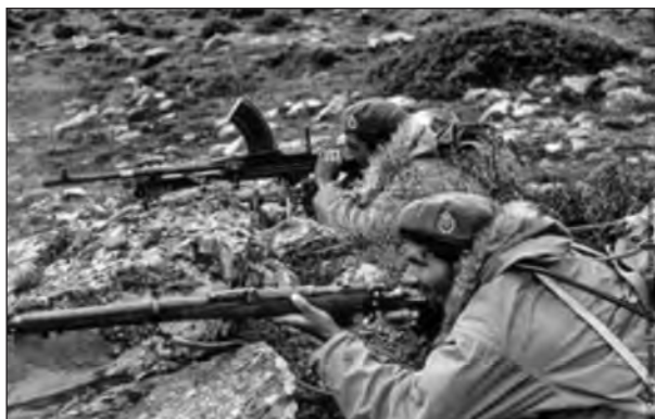
Άνδρες των ΛΟΚ κατά την διάρκεια της επιχείρησης ανακατάληψης του Καρπενησιού. Έχουν ακόμη τον αγγλικό οπλισμό.

"...μένομεν με την πεποίθησιν ότι περισσότερον από κάθε άλλητην περιοχίν εις ΣΗΔΜ (σ.σ. γεωγραφικό Συγκρότημα Ηπείρου-Δυτικής Μακεδονίας) είν' ενδεδειγμένη η δράσις των, ή τε ως έχει νυν το θέατρον επιχειρήσεων ή τε εις γενικωτέρας ενεργείας.."