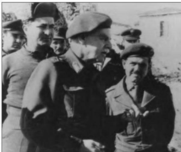
Ο στρατηγός Καλίνσκη, σε επίσκεψη μονάδων Καταδρομών

Είναι πολύ ενδιαφέρον το συμπέρασμα που κατέληξαν, το οποίο αφού συντάχθηκε υπό μορφή απορρήτου εγγράφου, μεταφέρθηκε από τον Καλίνσκη και παραδόθηκε προσωπικά στον Αρχιστράτηγο Παπάγο.